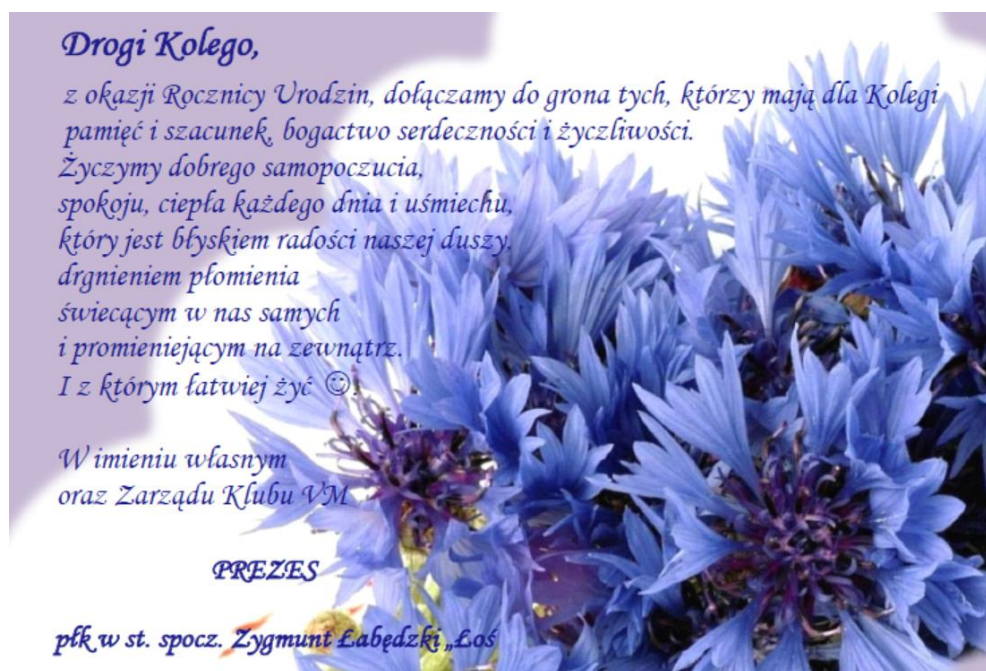
Projekt: L. Tryka

Jak co roku, wysłać będziemy do Was, drogie Koleżanki i drodzy Koledzy, tradycyjnie, kartki urodzinowe. Niech ten skromny wyraz naszej pamięci będzie dla Was miłym dodatkiem do wszystkich serdeczności. Tegorocznym Jubilatam życzymy serdecznie jak najwięcej życzliwości wokół, dobrego samopoczucia i radości na co dzień.