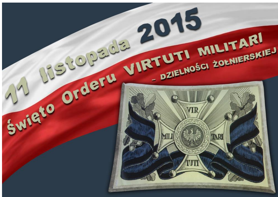
„Główka” kalendarza ściennego Klubu VM na 2015 rok. Projekt: R. Tryka

Mamy nadzieję, że kalendarz ścienny na 2015 rok spodobał się naszym Członkom. Jest on jednak szczególnie adresowany do tych wszystkich zapomnianych (albo niedoinformowanych), którzy podczas różnych uroczystości, spotkań i innych mniej, i bardziej oficjalnych okazji pomijają fakt, że 11 listopada, to nie tylko Narodowe Święto Niepodległości, ale i Święto Orderu Virtuti Militari.